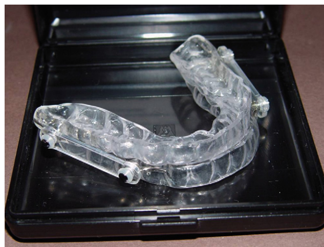
Fig. 1: The OPM 4 J. Fig. 1 : OPM4 J.

La pose a été réalisée après examen clinique et radiologique de la dentition par l'orthodontiste, permettant de vérifier sa capacité à supporter la force de propulsion ainsi que l'état des ATM et du parodonte. L'édentation complète mandibulaire